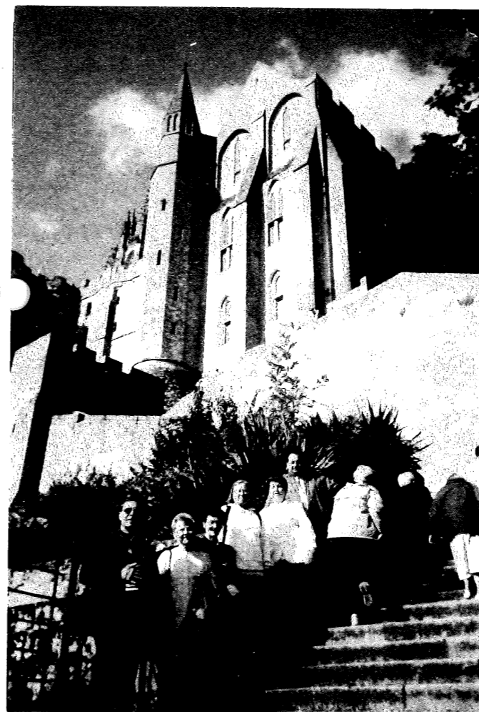
Quelques marches du Mont St Michel