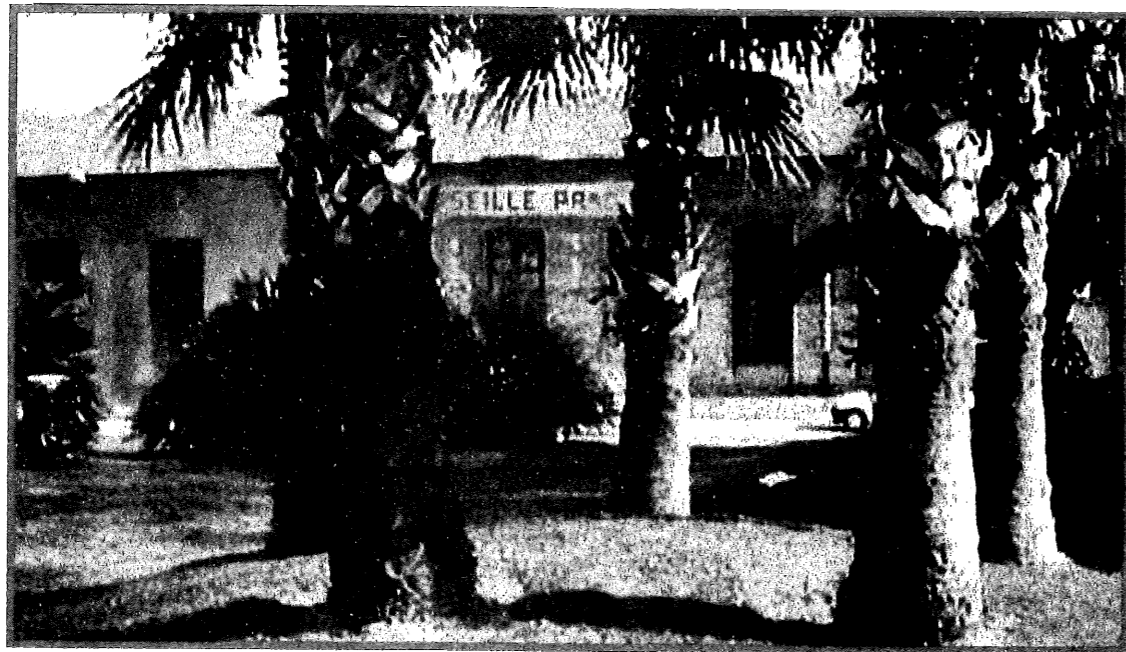
LA GARE DU PRADO

Chaque année tous les corps Elus de Marseille ne cessent de remettre des vœux demandant au Gouvernement d'obliger la Compagnie PLM à tenir enfin les engagements qu'elle a contractés en 1862. Mais la Compagnie est une puissance redoutée et il semble, à travers les documents consultés, qu'elle profite de cette situation pour laisser pourrir cette situation car le développement de Marseille n'est pas sa priorité.