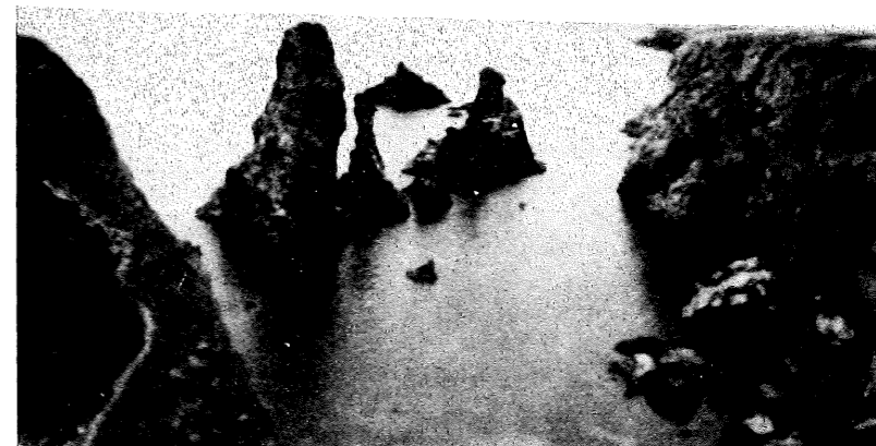
La Pointe du Raz

Au restaurant surplombant le port, le déjeuner est servi, toujours aussi copieux ; Les crustacés et coquillages sont d'une indiscutable fraîcheur. Paimpol, Dinan, Dinard sont traversées et voilà Saint-Jalo et ses remparts. Une courte halte. Le Beelem est ancré au port. La marée est montante. Une ville à visiter plus longuement, mais il faut arriver ce soir au Mont Saint-Michel.