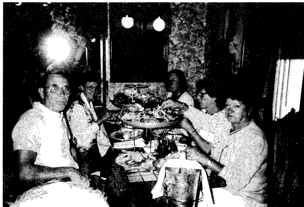
Niort. Coquillages chez Me Kanter

Par Nîmes, Carcassonne, Bordeaux et ses vignobles, Niort sera notre première étape. Le grand hôtel nous accueille par un apéritif musclé et le repas du soir chez Maître Kanter ne l'est pas moins (Jambonneau braisé et ses accompagnements).... La digestion sera laborieuse !