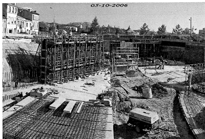
vue panoramique des travaux du Tunnel Louis Rège