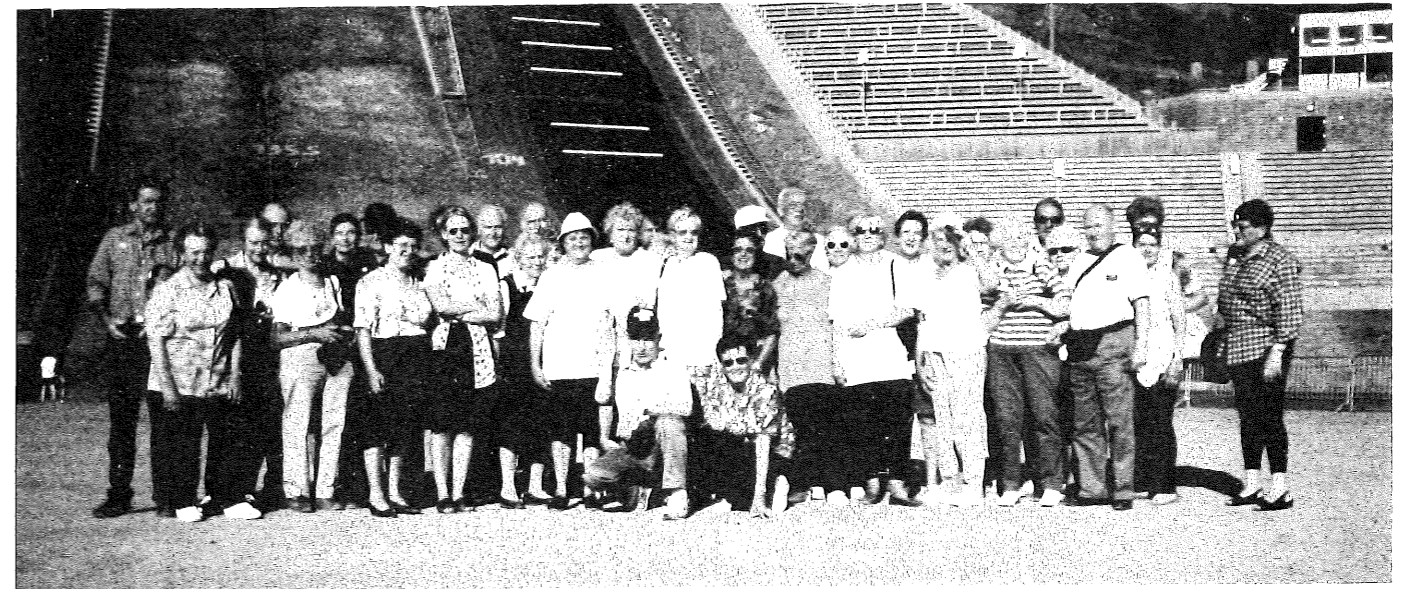
Une partie du groupe devant le tremplin olympique de Lillehammer