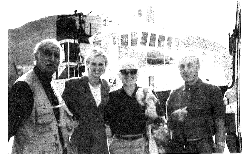
Visite commentée de BERGEN

Quel calme, on se croirait à la campagne.