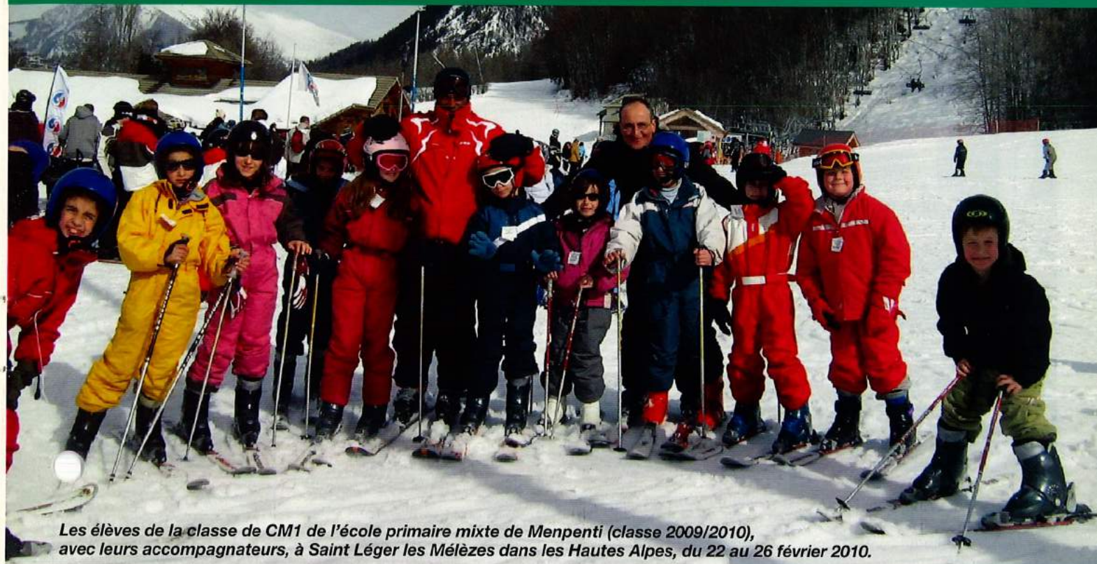
Les élèves de la classe de CM1 de l'école primaire mixte de Menpenti (classe 2009/2010), avec leurs accompagnateurs, à Saint Léger les Mèlèzes dans les Hautes Alpes, du 22 au 26 février 2010.