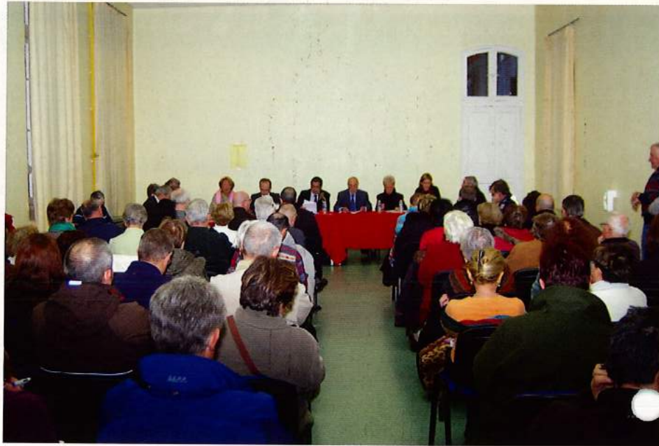
Vue d'ensemble de l'Assemblée Générale du Jeudi 28 janvier 2010, en présence de nombreux participants, Elus et Représentants de la Police Nationale et Police Municipale.