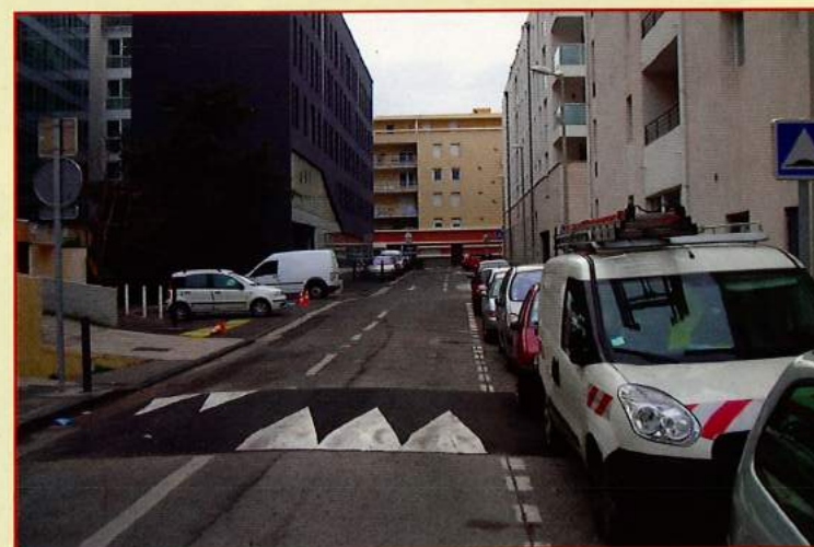
Suite à la demande de nombreux riverains, votre C.I.Q. est intervenu conjointement auprès de la Mairie de Secteur et de MPM, pour la création de 2 ralentisseurs rue de Pologne, à proximité de l'immeuble de bureau « Le Patio », qui ont été réalisés en fin novembre 2010.