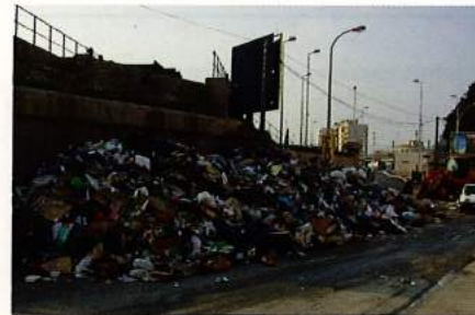
Dans le 1er trimestre 2010, Boulevard Bonnefoy 13010, à côté de l'un des Centres de transfert des Déchets Urbains, une situation intolérable pour l'hygiène et la Santé de nos habitants. Malheureusement, après le blocage de ces Centres de transfert par le personnel du privé, pour problème de Marché Public; en octobre 2010 la situation s'est répétée avec les conflits sociaux du Secteur Public. 2010 est une année à oublier; ce n'est pas l'image souhaitée de notre Ville; à l'avenir nous espérons ne plus jamais voir cette situation.